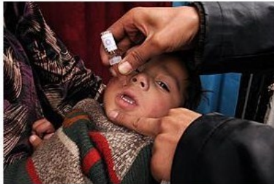
↑ Un niño afgano recibe una dosis de la vacuna contra la polio.

Parte de los fondos los administrará Rotary, una organización internacional integrada por 1.200.000 personas en más de 200 países, y otra parte irá destinada a la Iniciativa Global de Erradicación de la Polio (GPEI), apoyada por la propia Rotary, la OMS, Unicef y los Centros de Control y Prevención de Enfermedades (CDC).