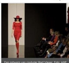
Een ontwerp van couturier Mart Visser.

De Rotary Club Rozendaal Veluwezoon organiseert eens per drie, vier jaar een dergelijk evenement voor een goed doel. Met de opbrengst van 100.000 euro werd het record dat in 2005 werd bereikt, geëvenaard. 'Een geweldige bedrag, in tijden waarin het economisch minder gaat', aldus een woordvoerder van Rotary.