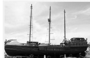
El trimarán artesanal 'Zamná', casi terminado, en su astillero de Yucatán.

Los promotores mexicanos llevan en su singladura navegantes mexicanos, españoles y canadiense, más un niño seleccionado en el país azteca que representa su lema pacífico. El capitán es el conocido navegante y expedicionario santanderino Vital Alsar. El navío sólo llevará dos emblemas en sus velas, que son el símbolo de la paz y el de Rotary Club Internacional con la palabra Paz escrita en 24 idiomas. El proyecto invita a difundir la canción El niño, la mar y la paz del cantautor yucateco Sergio Esquivel.